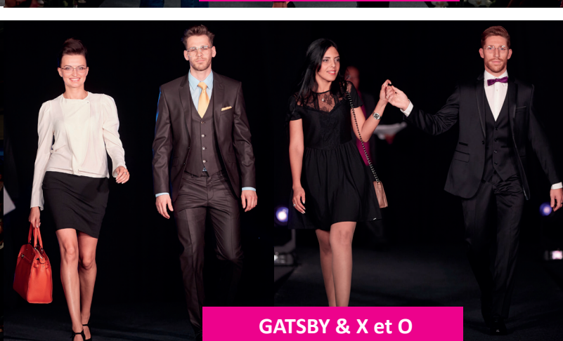
GATSBY & X et O