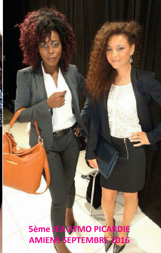
5ème IEA ATMO PICARDIE AMIENS SEPTEMBRE 2016