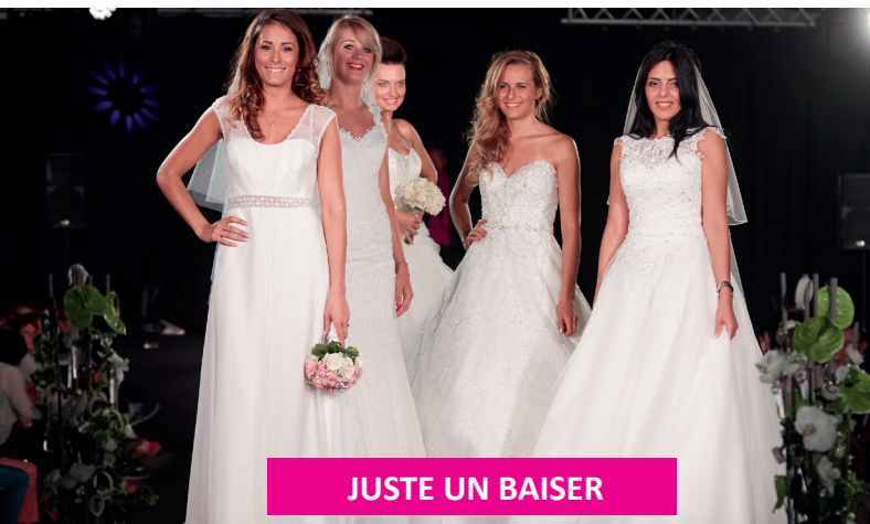
JUSTE UN BAISER