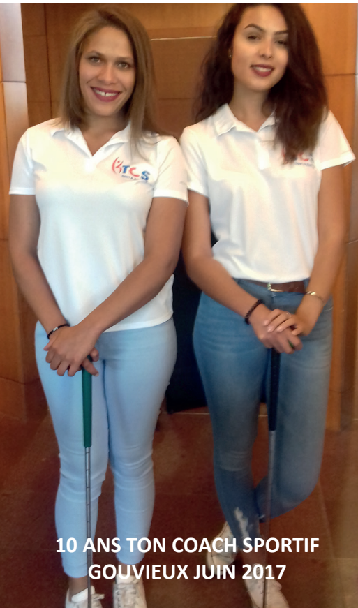
10 ANS TON COACH SPORTIF GOUVIEUX JUIN 2017