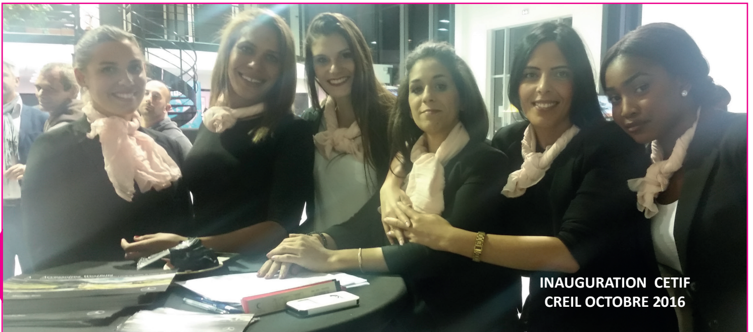
INAUGURATION CETIF CREIL OCTOBRE 2016