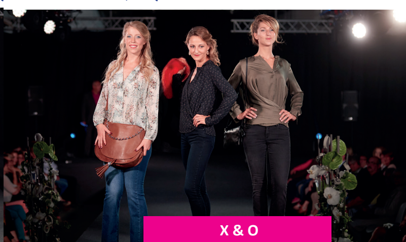
X & O