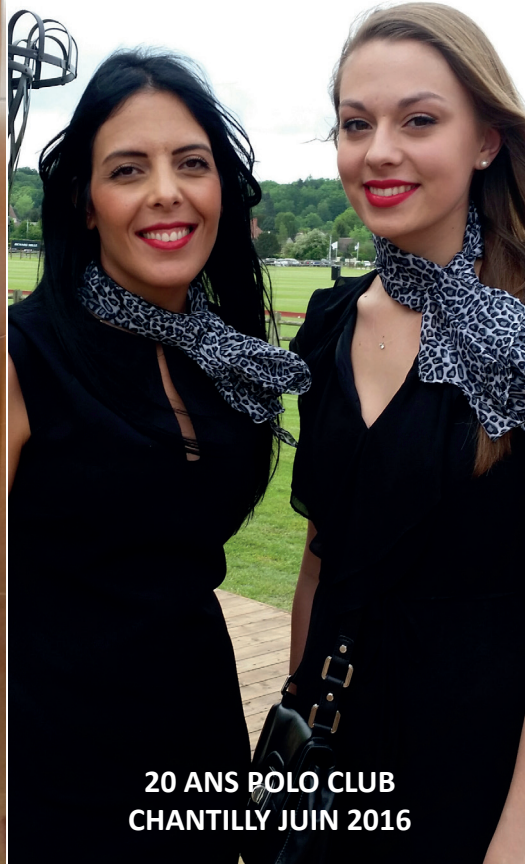
20 ANS POLO CLUB CHANTILLY JUIN 2016